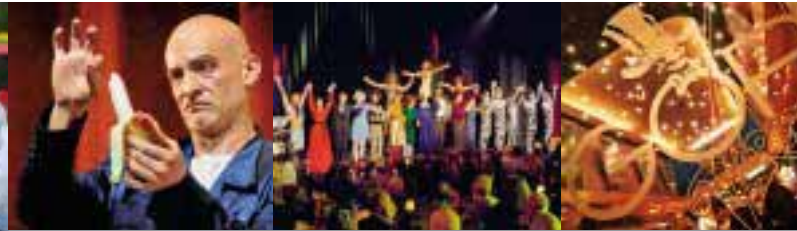
Bad Oeynhausen, Essen, Hannover oder Münster

Fahrkartenerstellung im Fernverkehr: unbedingt die KU-NR-(Galileo) bzw. BMIS-NR. (NVS) 410 16 41 eingeben; (Tickettyp „GR“ bzw. „GK“)