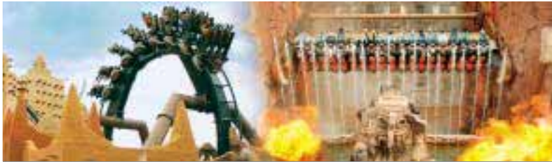
Brühl bei Köln