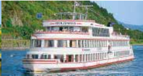
Schiff ahoi! – mit der Köln-Düsseldorfer