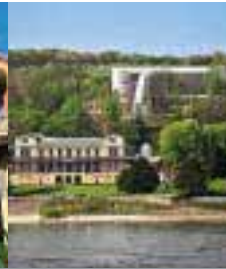
Rolandseck bei Bonn