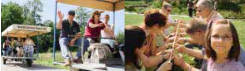
Ostbevern bei Münster