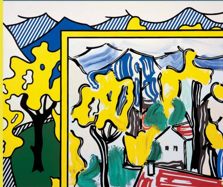
Roy Lichtenstein, Painting in Landscape, 1984 Fondation Beyeler, Riehen/Basel © VG Bild-Kunst, Bonn 2011 · Foto: Peter Schibli

Warum aber ist Landschaft überhaupt schön, fragen wir mit dem Soziologen und Kulturwissenschaftler Lucius Burckhardt, der sich im Rahmen der von ihm entwickelten »Spaziergangswissenschaft« intensiv mit der Gestaltung der Landschaft durch den Menschen und mit ihrer Wahrnehmung beschäftigt hat.