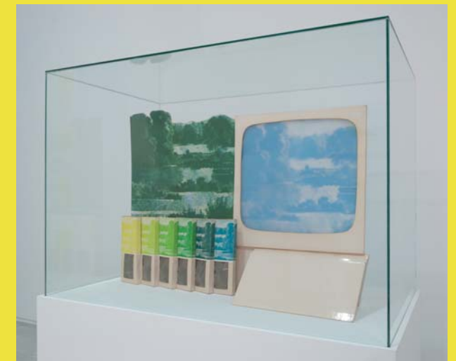
KP Brehmer, Aufsteller Ideale Landschaft II, 1968 Sammlung Block, Leihgabe im Neuen Museum in Nürnberg © VG Bild-Kunst, Bonn 2011

Die Figur des Wanderers, der die Landschaft intensiv wahrnimmt, indem er sich durch sie hindurch bewegt, spielt in der Ausstellung in zweierlei Hinsicht eine Rolle: Zum einen werden mehrere Arbeiten gezeigt, in denen sich die Künstler/innen als Wandernde durch die Landschaft bewegen, zum anderen erschließen sich auch die Besucher/innen die Ausstellung wie in einer Wanderung durch die unterschiedlichen Landschaftsformen. Auf diesem Weg werden auch Verbindungswege zu ausgewählten Arbeiten in der Kunstkammer Rau im Arp Museum Bahnhof Rolandseck sowie zu Stationen des Skulpturenufers am Rhein angeboten.